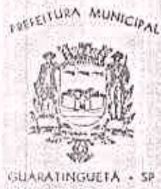
TABELA SALARIAL DOS SERVIDORES DA ÁREA DE INFORMÁTICA (anexa à Lei nº 2.123, de 14.12.89)