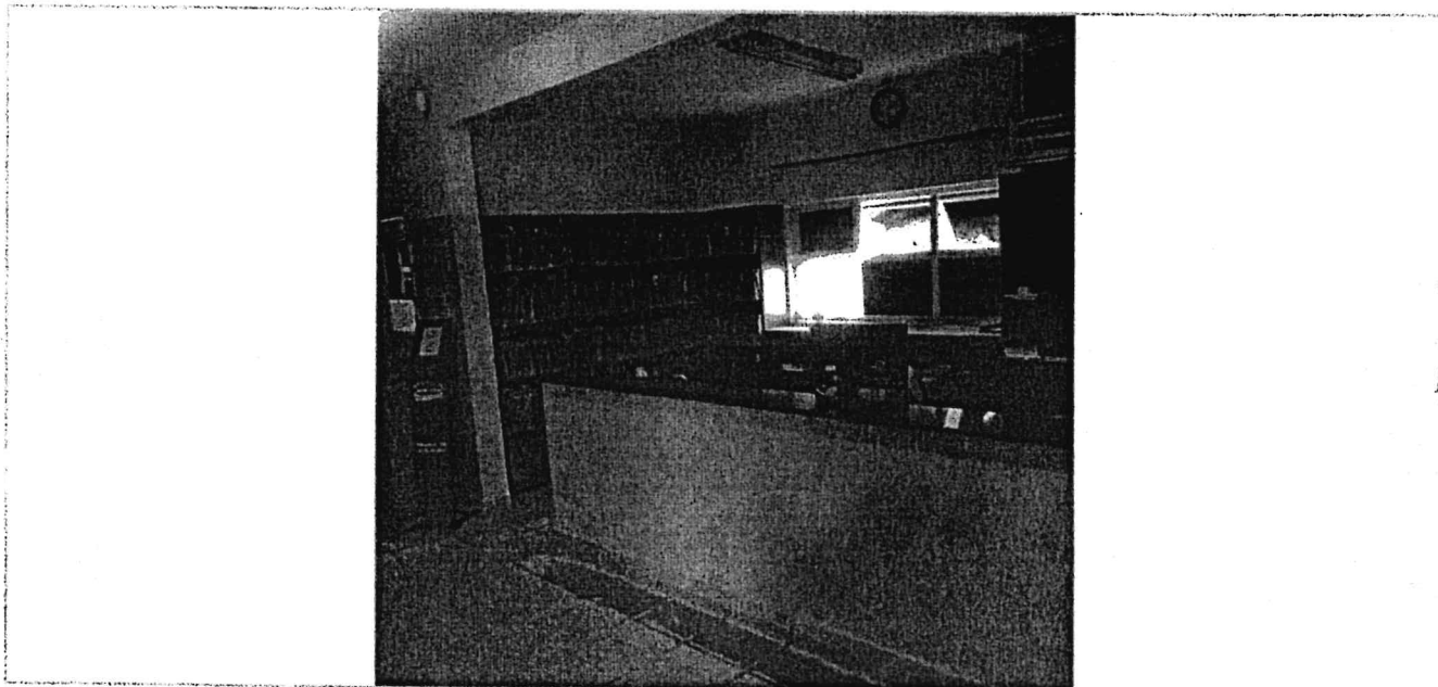
Data da última atualização: 13/03/2020