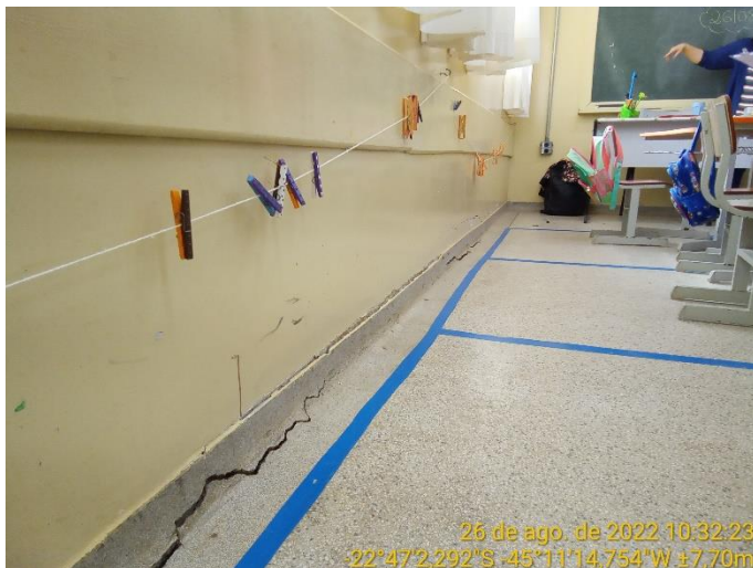
6.1 Piso sala de aula com rachadura

Na sala de aula das fotografias, o piso em granilite apresenta rachadura na parede onde estão as janelas. A rachadura à 45° na parede também atingiu a lousa.