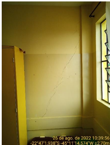
11.1 Trinca à 45° na parede da sala de aula

Data: 26 / 08 / 2022 Processo: Folha: 11 / 12