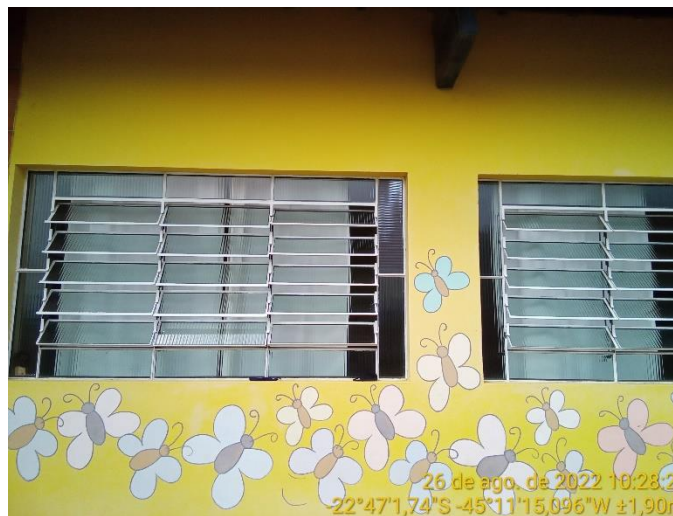
4.2 Detalhe do item 4.1 sem danos