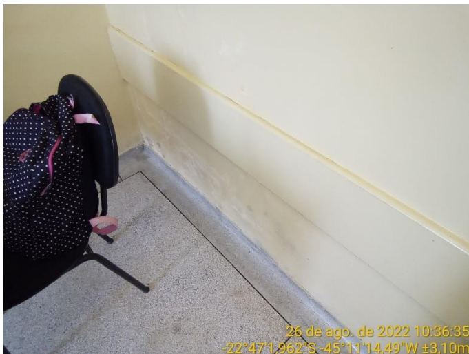
9.1 Mancha de umidade na parede