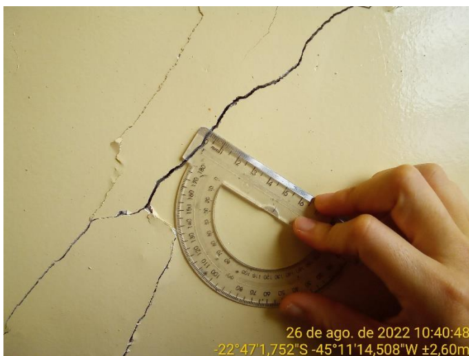
11.3 Detalhe trinca à 45° na parede da sala de aula (+ 1 mm)