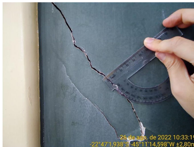
6.3 Detalhe rachadura à 45° na lousa de giz