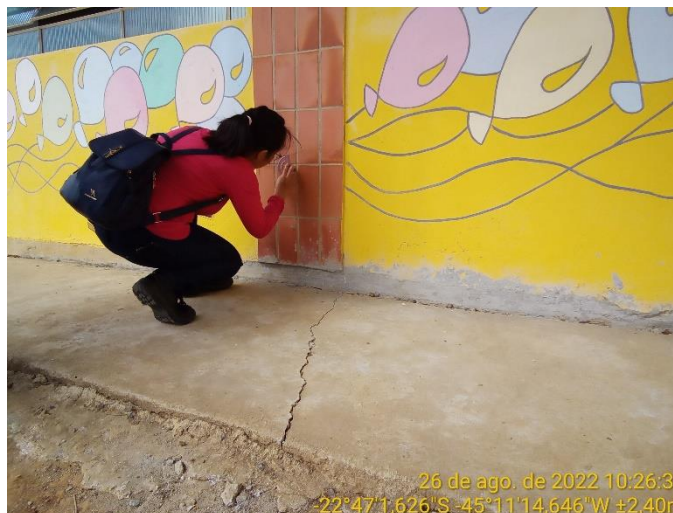
2.4 Rachadura calçada