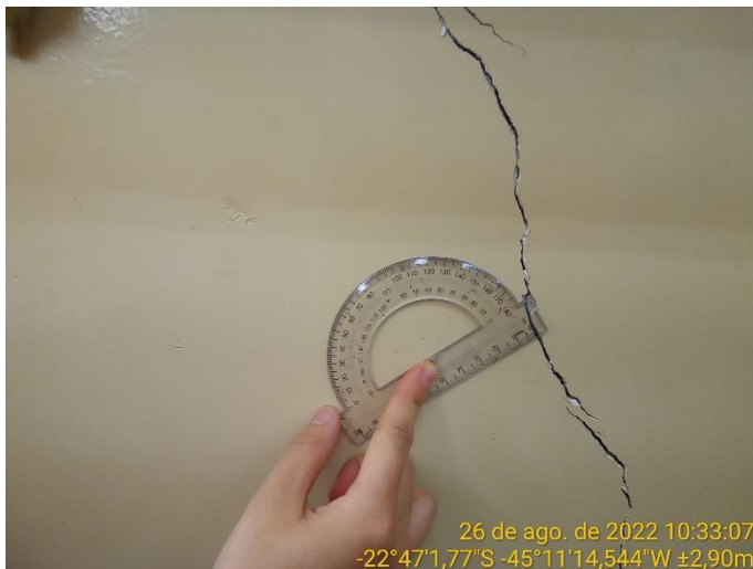
7.3 Detalhe revestimento argamassado rompido