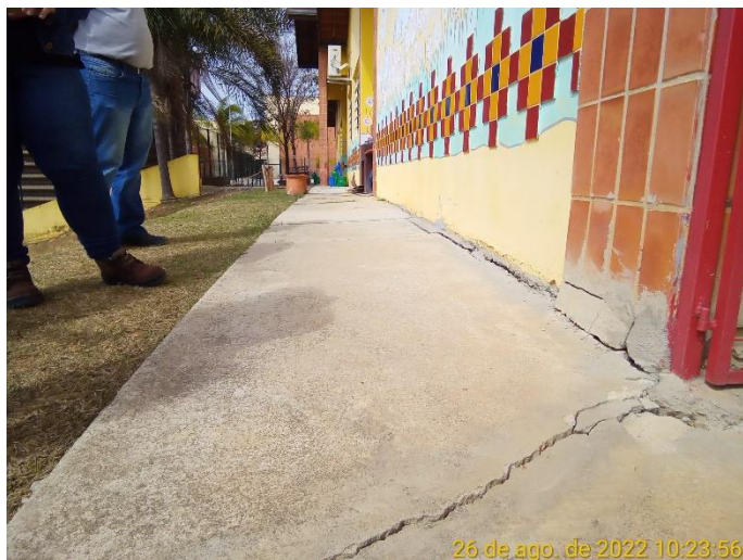
1.1 Rachadura na calçada que contorna a escola

Medida corretiva: Investigar a causa da movimentação da edificação.