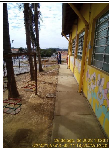
4.4 Lateral da escola sem danos