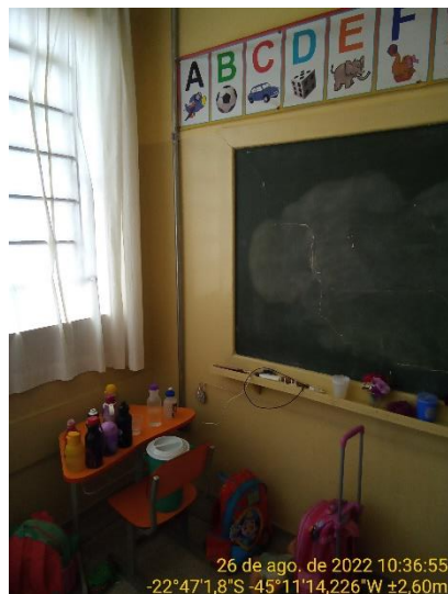
9.3 Detalhe rachadura à 45° na lousa de giz