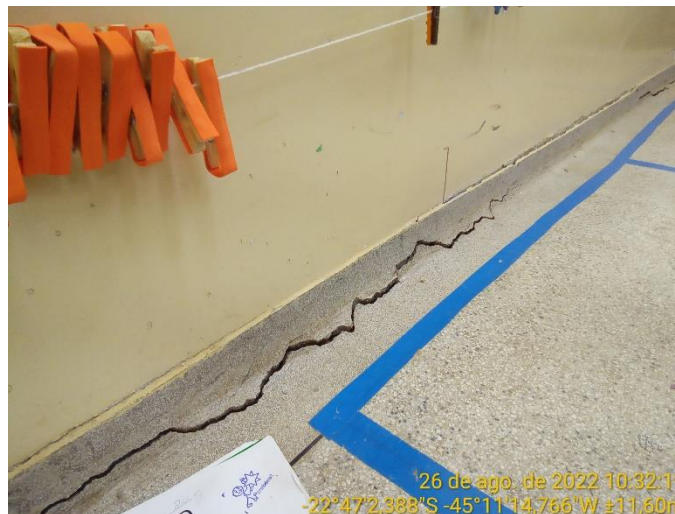
6.2 Detalhe piso sala de aula com rachadura