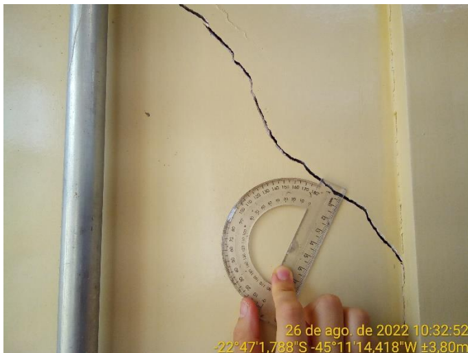
7.1 Revestimento argamassado rompido

Internamente as quinas das janelas também apresentam trincas.