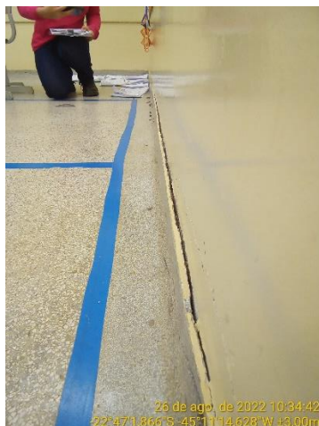
8.3 Descolamento piso moldado in loco da parede