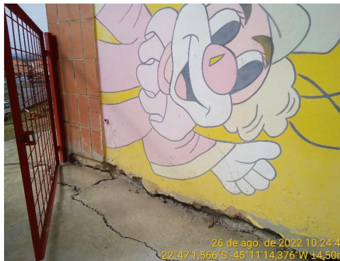
1.4 Detalhe vão entre a calçada e a parede da escola criado pela movimentação da edificação