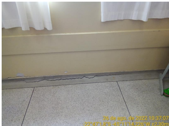
10.1 Piso sala de aula com rachadura