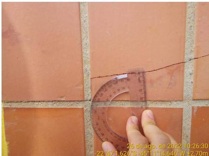
2.3 Trinca no revestimento cerâmico da parede externa