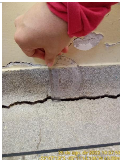
10.3 Detalhe piso sala de aula com rachadura