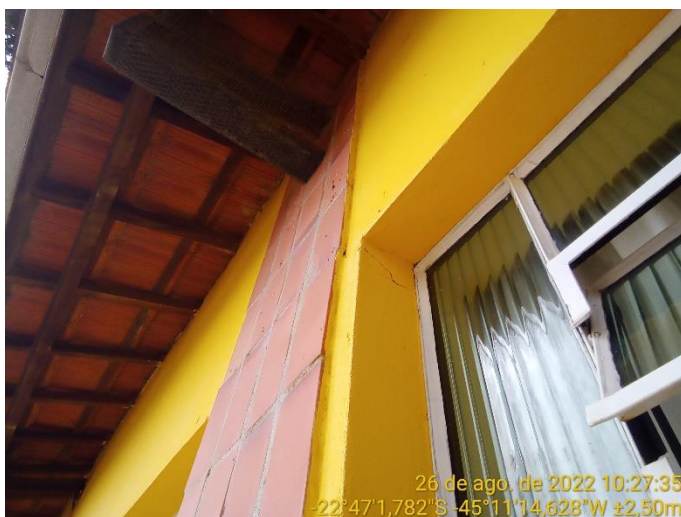
3.3 Trinca na parede próxima à quina da janela (parte superior)