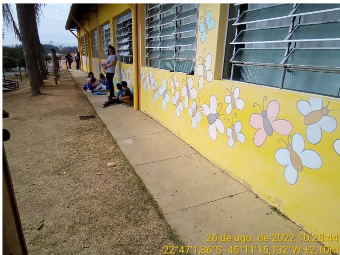
4.1 Lateral da escola sem danos

As fachadas laterais e de fundo da escola não apresentam danos evidentes causados pela movimentação da edificação. Portanto, caracteriza-se recalque diferencial, pois parte da edificação se manteve na posição inicial e outra parte se movimentou.