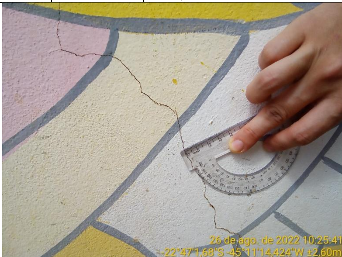
2.1 Fissura na parede externa da escola

A movimentação da edificação afetou as paredes externas da escola, criando fissuras e trincas capazes de romper o revestimento cerâmicos.