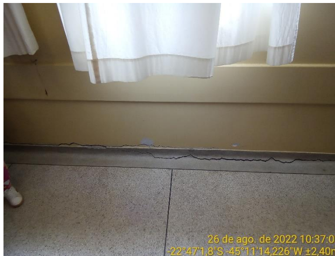
9.4 Piso sala de aula com rachadura