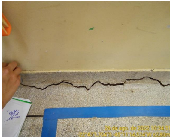
8.1 Piso sala de aula com rachadura

A movimentação da edificação causou o descolamento do piso granilite moldado in loco em relação à parede.