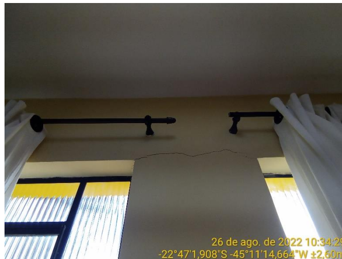
7.4 Trinca nas quinas das janelas (visão interna)