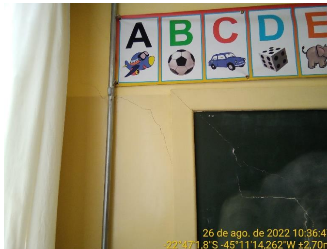
9.2 Rachadura à 45° na parede da sala de aula