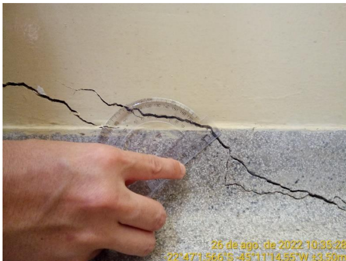
12.1 Detalhe trinca à 45º no piso da sala de aula (+ 1 mm)

O piso do corredor está danificado, com trinca.