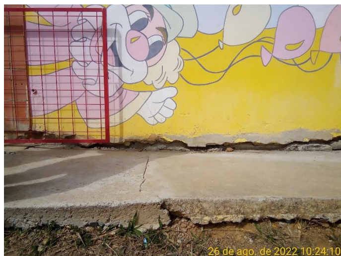
1.3 Vão entre a calçada e a parede da escola criado pela movimentação da edificação