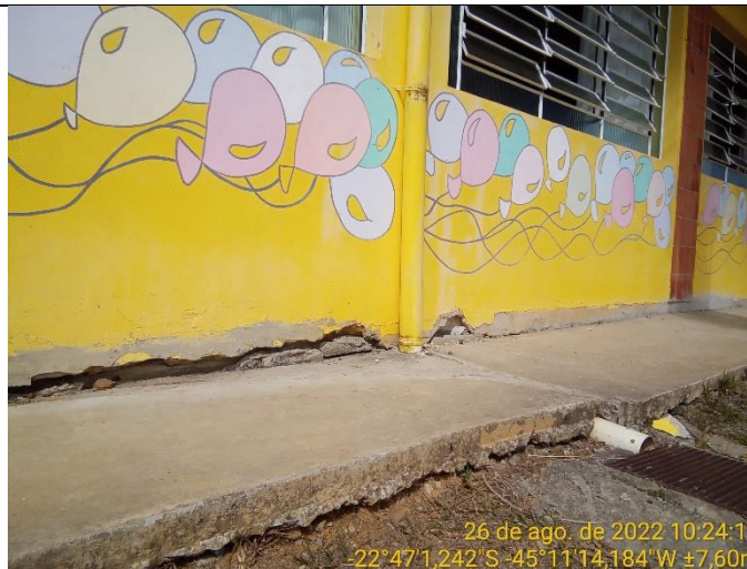
2.2 Vão entre a calçada e a parede da escola