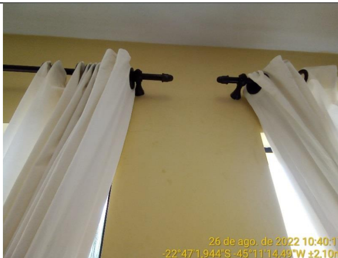
11.2 Fissura nas quinas das janelas (visão interna)