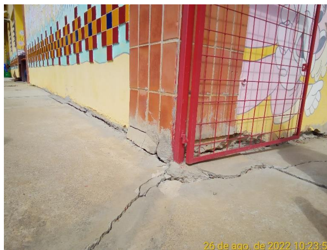
1.2 Detalhe rachadura na calçada que contorna a escola