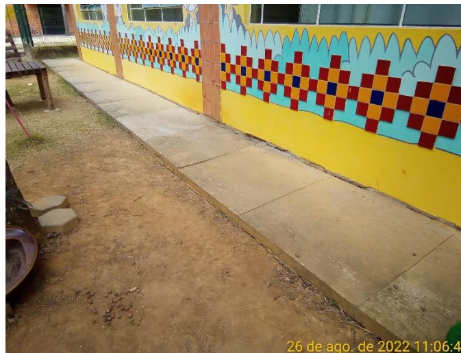
5.2 Abertura vão entre a parede externa e a calçada