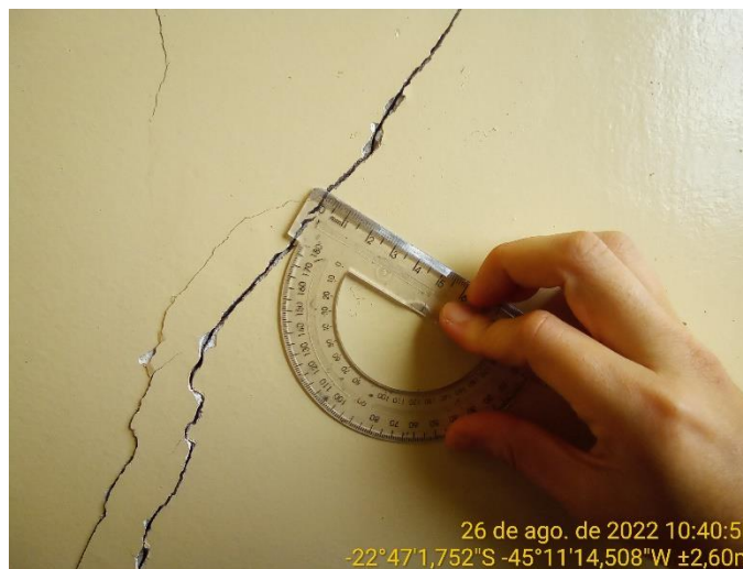
11.4 Detalhe trinca à 45° na parede da sala de aula (+ 1 mm)