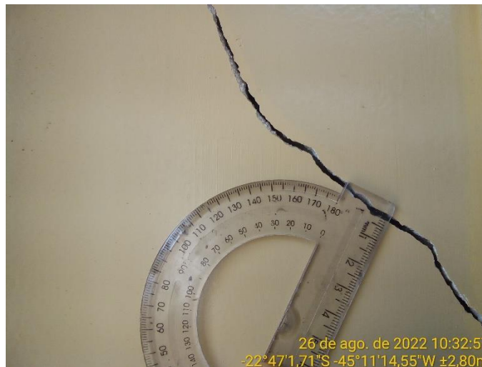
7.2 Detalhe revestimento argamassado rompido