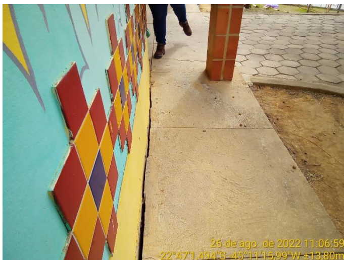
5.3 Detalhe abertura vão entre a parede externa e a calçada