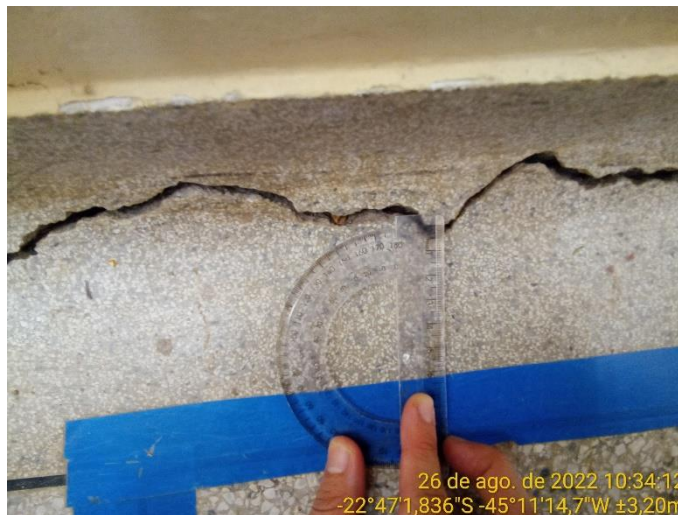
8.4 Detalhe piso sala de aula com rachadura