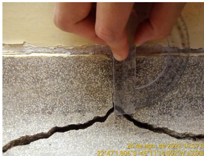
10.2 Detalhe piso sala de aula com rachadura (+ 5 mm)