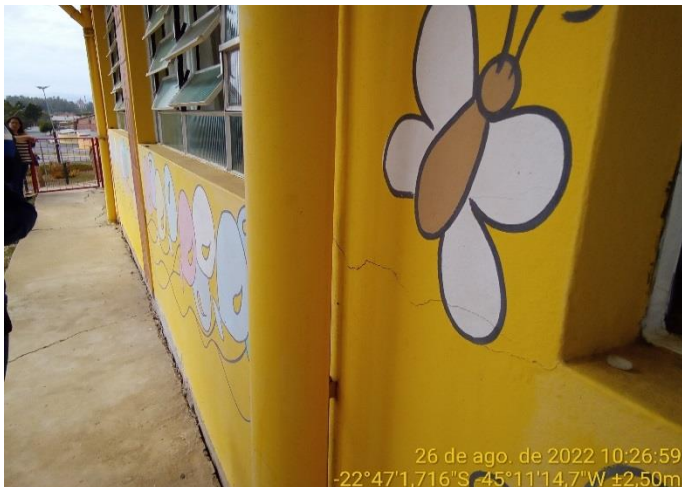
3.1 Trinca na parede próxima à quina da janela (parte inferior)

Também devido à movimentação da edificação, é observável que nas quinas das janelas existem trincas.