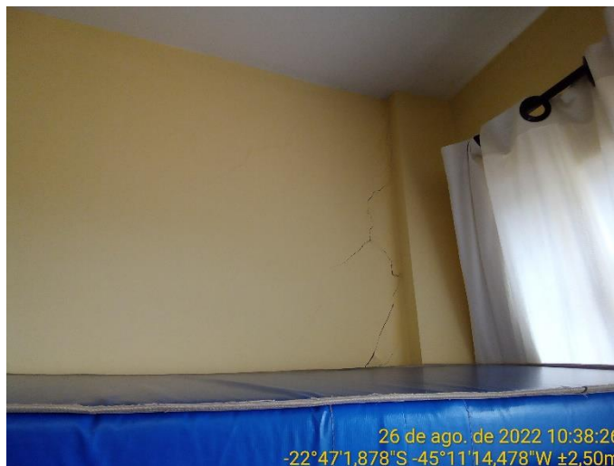
10.4 Rachadura à 45° na parede de sala de aula