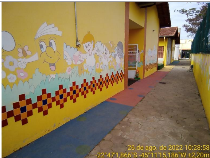
4.3 Fundo da escola sem danos