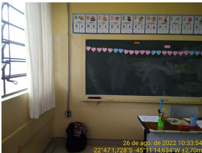
6.3 Rachadura à 45° na parede da sala de aula