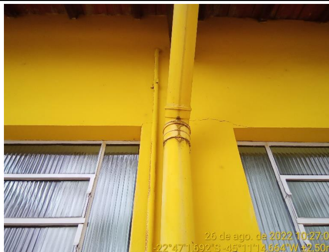
3.2 Trinca na parede próxima à quina da janela (parte superior)