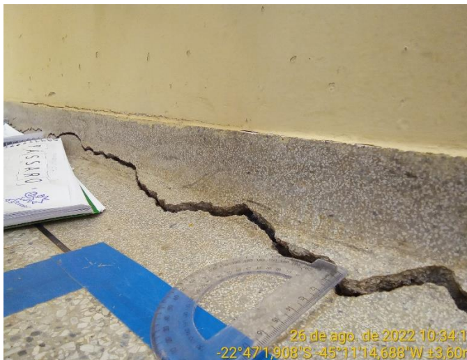
8.2 Detalhe piso sala de aula com rachadura