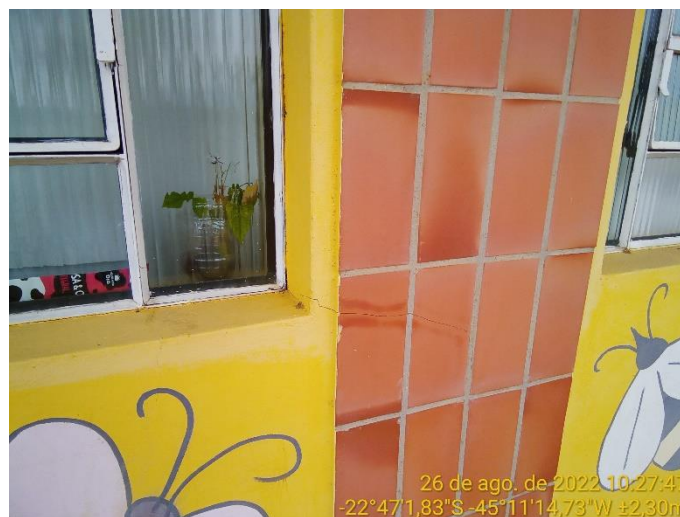
3.3 Trinca na parede próxima à quina da janela (parte superior) (também rompeu o revestimento cerâmico)