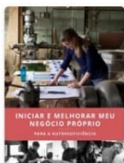
Iniciar e Melhorar Meu Negócio – Autossuficiência