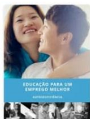
Educação para um Emprego Melhor – Autossuficiência