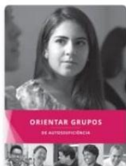
Orientar Grupos de Autossuficiência