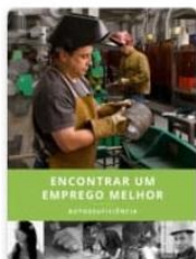
Encontrar um Emprego Melhor – Autossuficiência