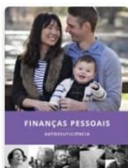
Finanças Pessoais para Autossuficiência