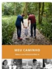
Meu Caminho para a Autossuficiência