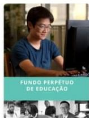
Fundo Perpétuo de Educação