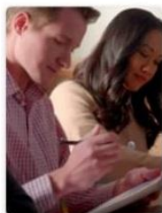
Vídeos de Autossuficiência