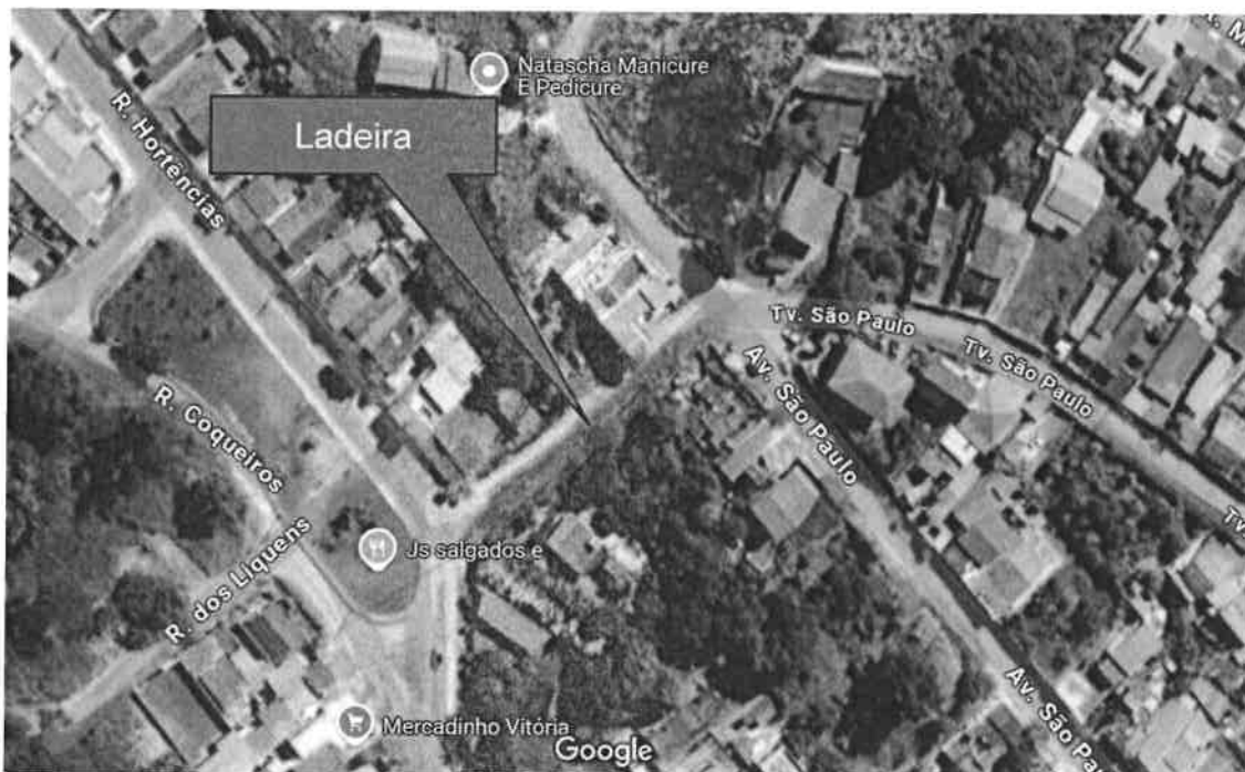
Figura 1: Localização do trecho da ladeira com RDA/RCE expostos

2- A rede coletora de esgotos (RCE), dn 150mm – PVC, encontra-se exposta somente no trecho onde existe um poço de visita (PV) intermediário, porém apresenta tampa em concreto quebrada. Os mesmos problemas citados quanto à RDA são aqui observados nas fotos 5 e 6, que inclusive mostram blocos de concreto inteiros utilizados indevidamente no preenchimento das valas;