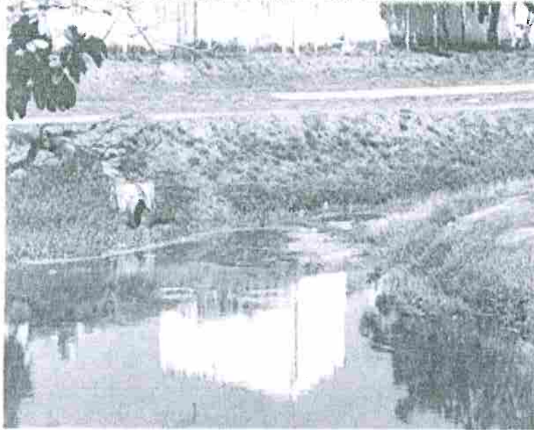
REPRESA COM RESQUÍCIOS DE OLEO/ESGOTO