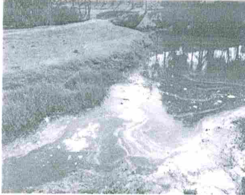
REPRESA COM RESQUÍCIOS DE OLEO/ESGOTO