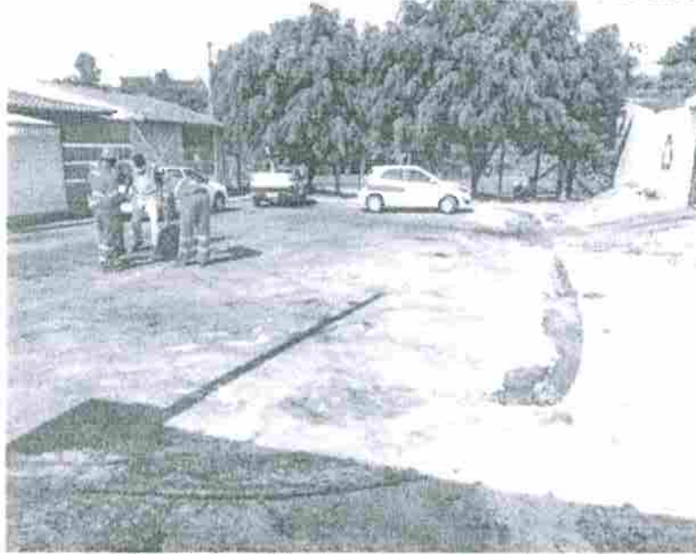
SAEG realizando a inspeção da rede de esgoto